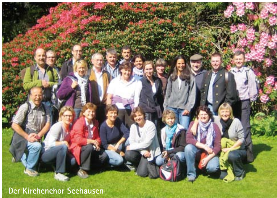
Der Kirchenchor Seehausen

Am Abend des 1. Mai landeten wir wohlbehalten wie-